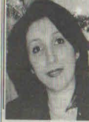
Legal Document Assistant LDA -549

15 տարի Կալիֆորնիայում փաստաբանի հետ աշխատած մասնագետ